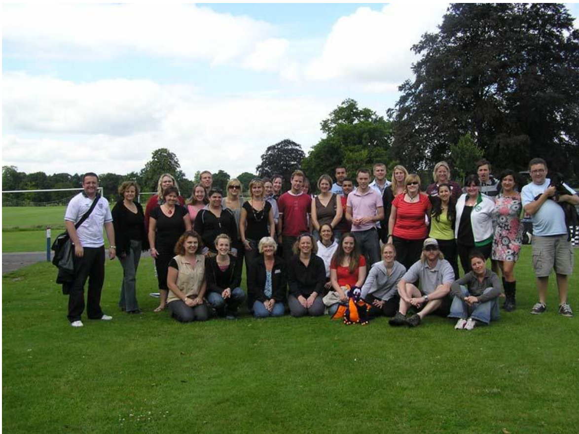
Конференція керівників Camp America в США

То ж, якщо Ви студент денного відділення віком від 18 до 23 років, маєте достатній рівень знань з англійської мови та бажання спробувати себе в програмі Camp America – у вас є для цього прекрасна можливість! Чи скористатися нею – це вже вирішувати Вам.