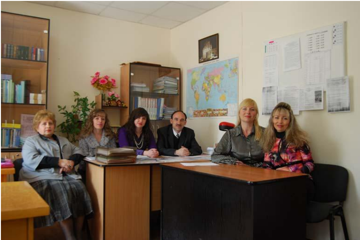
Колектив кафедри історії