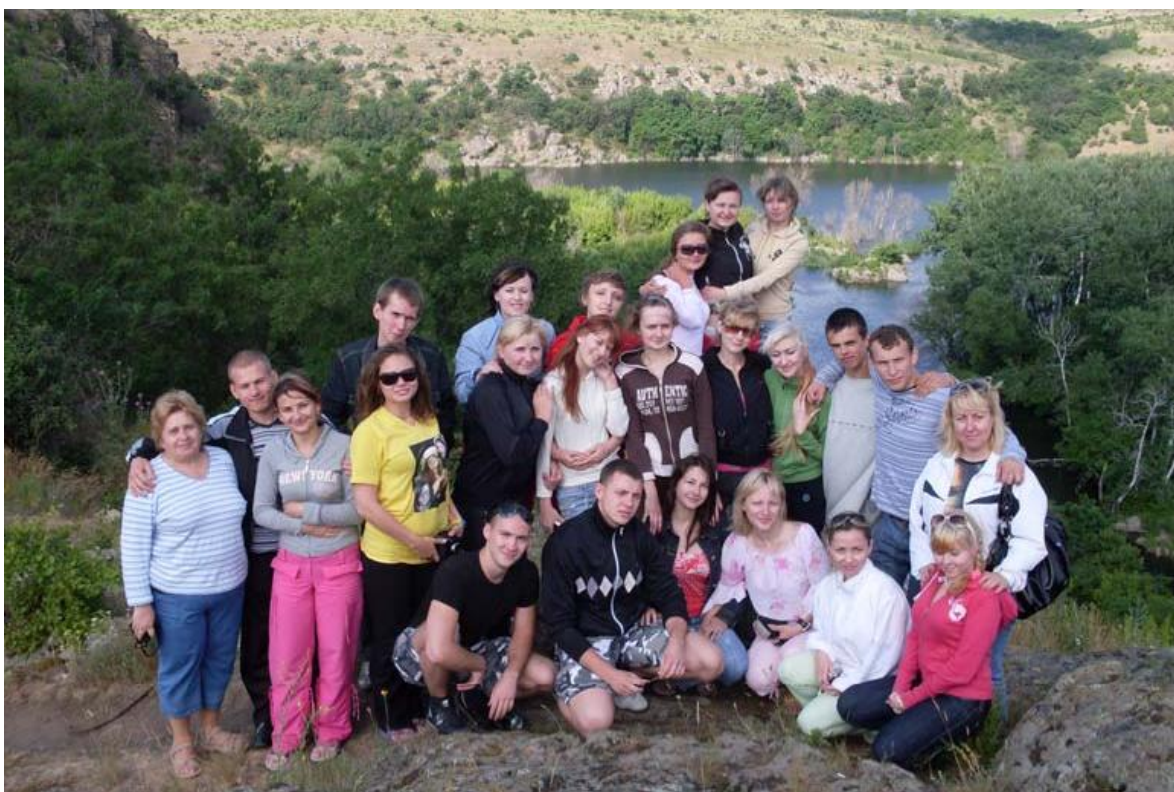
Студенти факультету на археологічних розкопках в селі Анетівка Доманівського району

В останній час велику зацікавленість у студентів викликає вивчення китайської мови. Цьому сприяє й запровадження спеціалізованого курсу в Інституті Конфуція, який передбачено відкрити у ЧДУ імені Петра Могили за сприяння китайського університету м. Дечжоу, з яким укладено договір про співробітництво і обмін студентами та викладачами. Філіали Інституту Конфуція нині діють у багатьох країнах Європи та Азії. У 2007 р. у Києві, а в 2008 р. у Харкові теж почали діяти такі Інститути. У січні 2010 р. делегація ЧДУ імені Петра Могили в рамках програми «Підхід до Китаю» відвідала КНР і сприяла розгортанню роботи з вивчення китайської мови та культури. У червні 2010 р. ЧДУ імені Петра Могили відвідала делегація з Китаю. А у листопаді 2010 р. три студенти університету розпочали річне навчання в Дечжоузькому університеті.