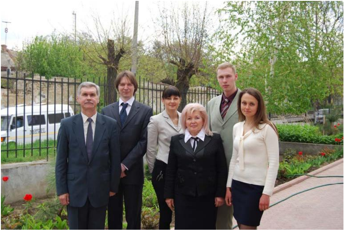
Колектив кафедри політичних наук