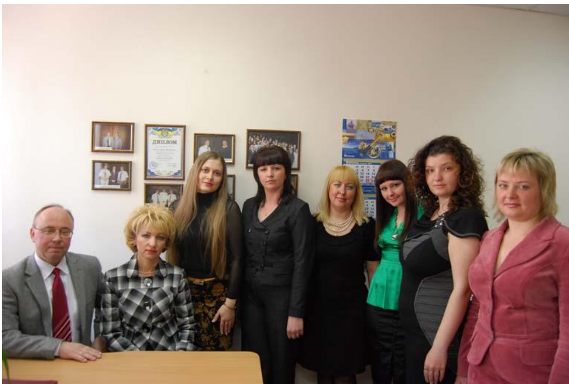
Колектив кафедри всесвітньої історії