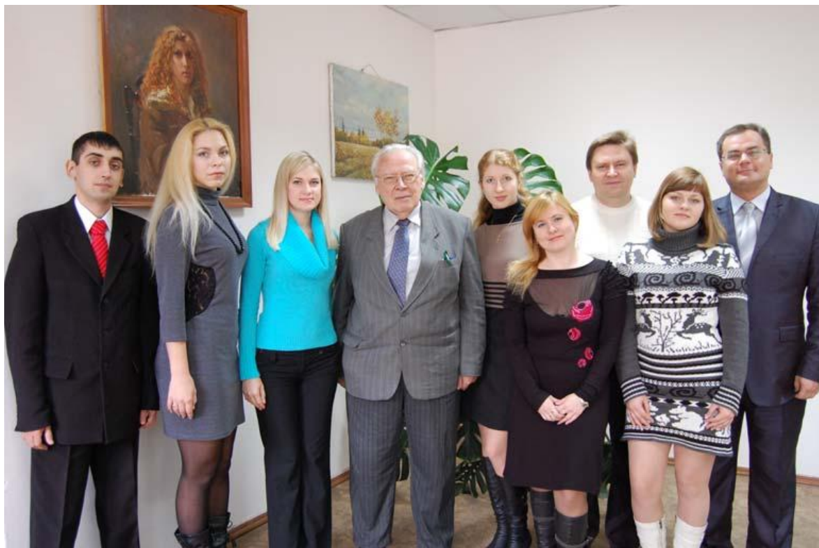
Колектив кафедри міжнародних відносин та зовнішньої політики

Колектив кафедри працює зі студентами у науковому та виховному плані, підтримує творчі зв'язки з відповідними кафедрами Інституту міжнародних відносин Київського національного університету ім. Тараса Шевченка, Донецького національного університету, Одеського національного університету ім. І. І. Мечникова, Інститутом історії України НАН України, цілого ряду університетів Російської Федерації, Угорщини, Латвії, Польщі та інших країн.