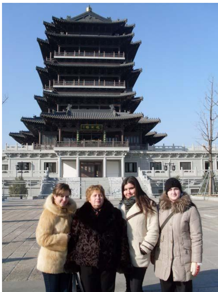
Перебування делегації університету в Китаї