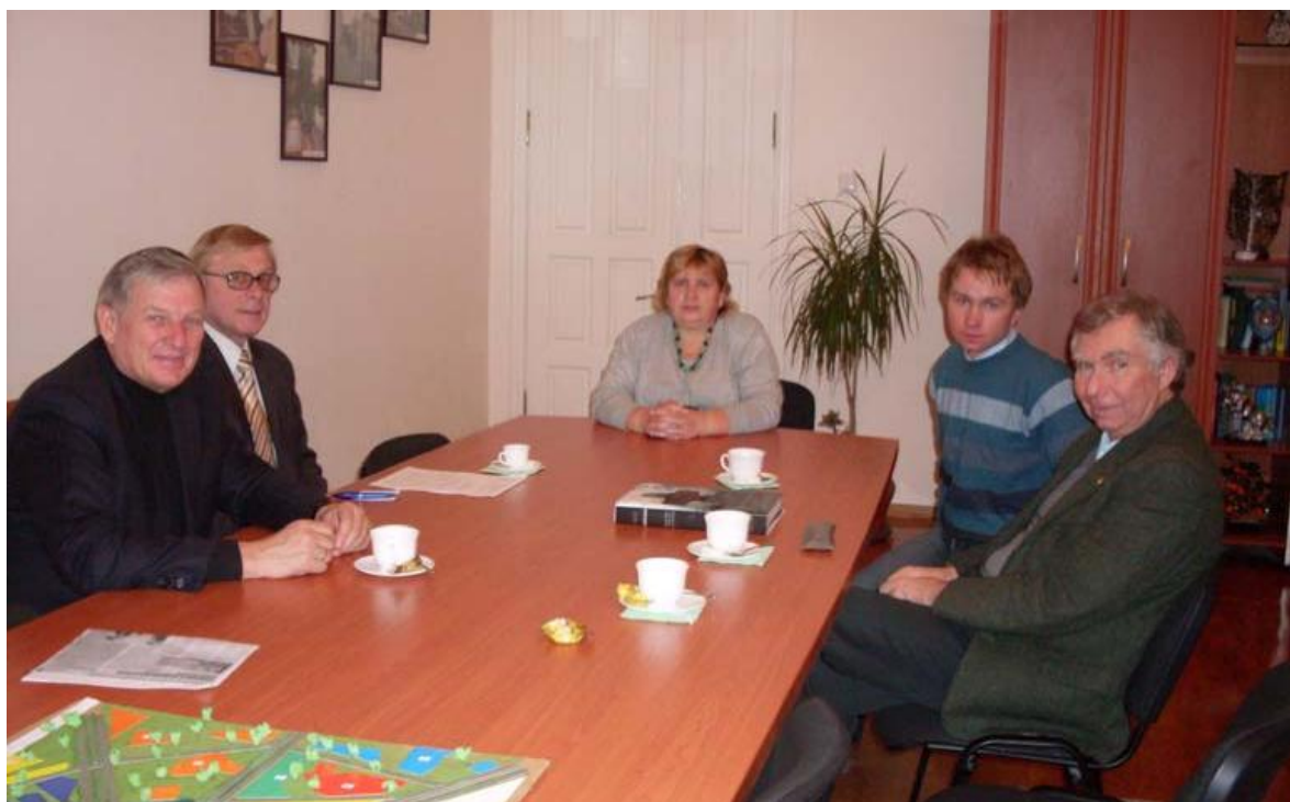
Зустріч з представниками університету Ка Фоскарі (Італія)