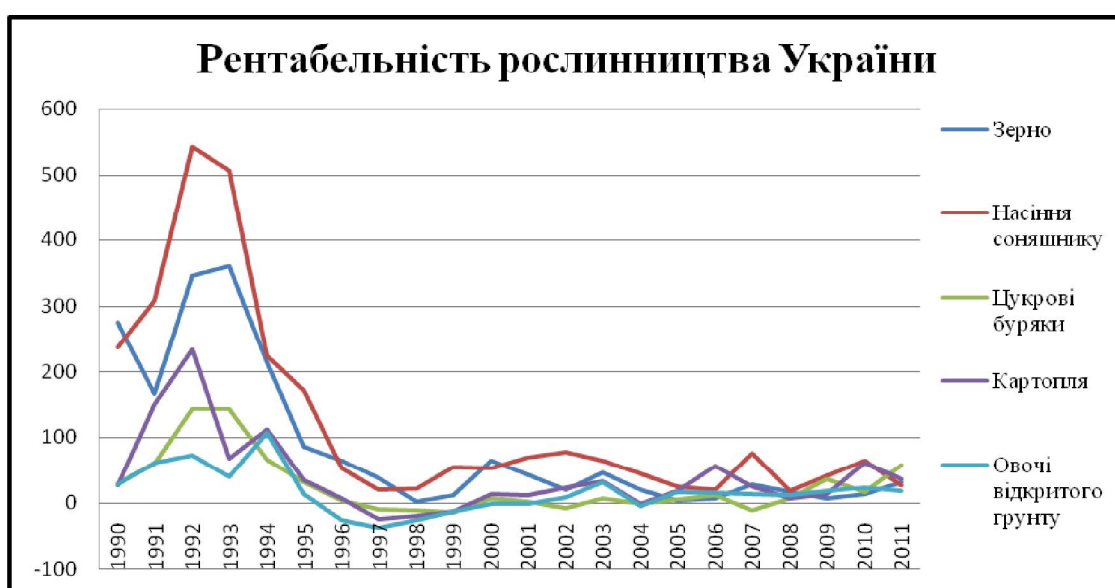
Рис. 1. Аналіз рентабельності виробництва продукції рослинництва в Україні, 1990-2011 роки

рослинництва в Україні, 1990-2011 роки» та рис. 2. «Аналіз рентабельності виробництва продукції тваринництва в Україні, 1990-2012 роки».