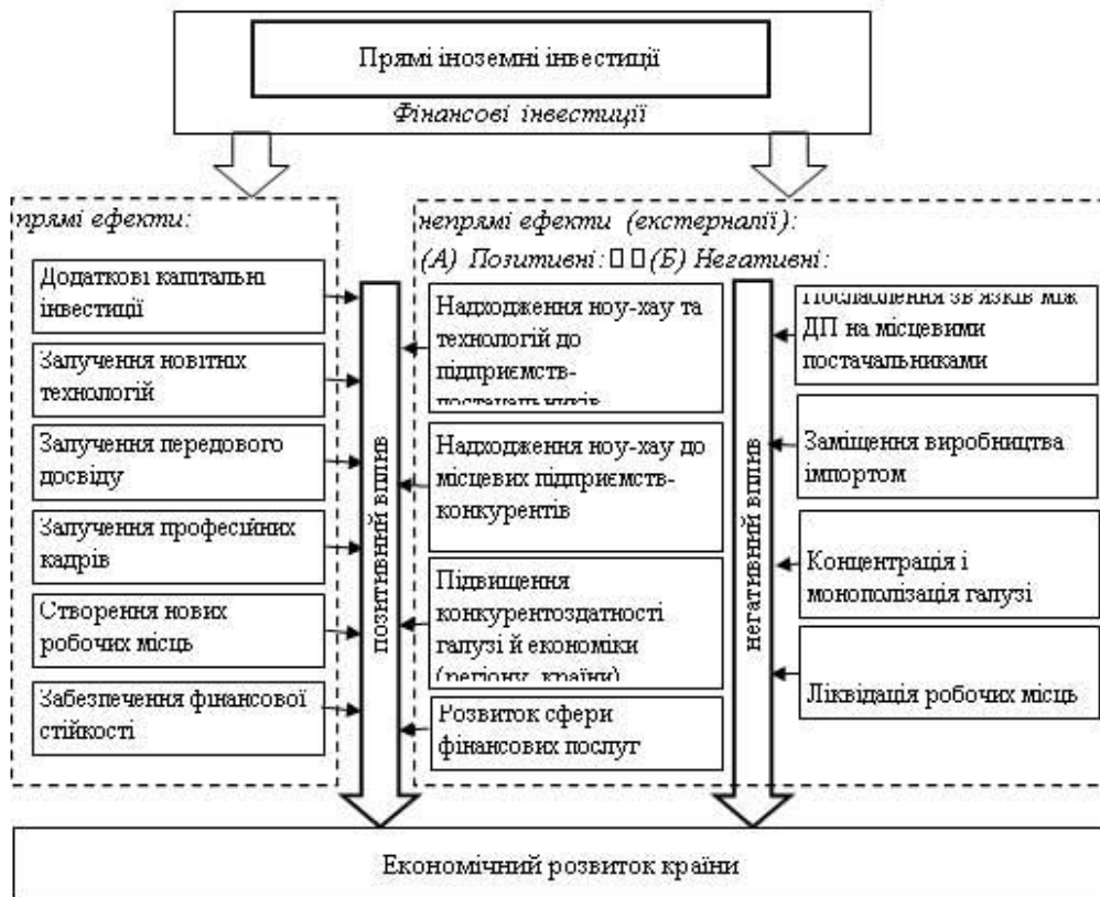
Рис. 2. Шляхи впливу фінансових інвестицій на економічний розвиток

Дослідження, проведене Дж. Менсінджером у 2003 році із застосуванням тесту причинно-наслідкового зв'язку Гранджера, виявило від'ємну залежність між прямими іноземними інвестиціями та економічним зростанням у восьми країнах Центральної та Східної Європи протягом 1994–2001 років. Негативний вплив прямих іноземних інвестицій на економічний розвиток у даних країнах у 1994–2001 роках пояснюється характером іноземних інвестицій, який тоді переважав – переважну частину прямих іноземних інвестицій становили не інвестиції в нові підприємства (greenfield investments), а поглинання та приватизація місцевих підприємств іноземними інвесторами. Було виявлено такі можливі негативні наслідки впливу фінансових (прямих іноземних) інвестицій на економічний розвиток: