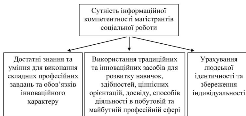
Рис. 1. Сутність інформаційної компетентності магістрантів соціальної роботи

Отже, інформаційна компетентність магістрантів соціальної роботи – це якість особистості, що виражається системоутворювальним комплексом спеціальних знань та умінь, достатніх для виконання складних професійних завдань та обов'язків інноваційного характеру, навичок, здібностей, ціннісних орієнтацій, досвіду, способів діяльності, набутих за допомогою традиційних та інноваційних засобів, і виражених у побутовій та майбутній професійній сфері магістрантів соціальної роботи з обов'язковим урахуванням людської ідентичності та індивідуальності.