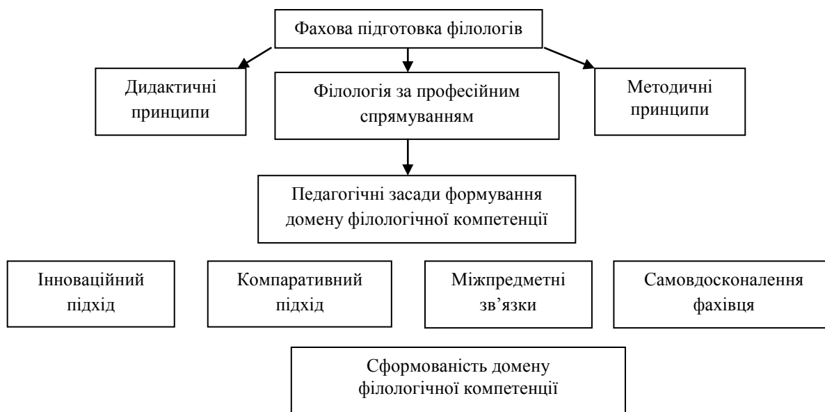
Рис. 1. Схема формування домену філологічної компетенції

Формування домену компетентнісного підходу в підготовці майбутніх філологів можна представити у вигляді схеми, яка дає уявлення про поступовий характер становлення фаховості спеціалістів та наведено на рис. 1.