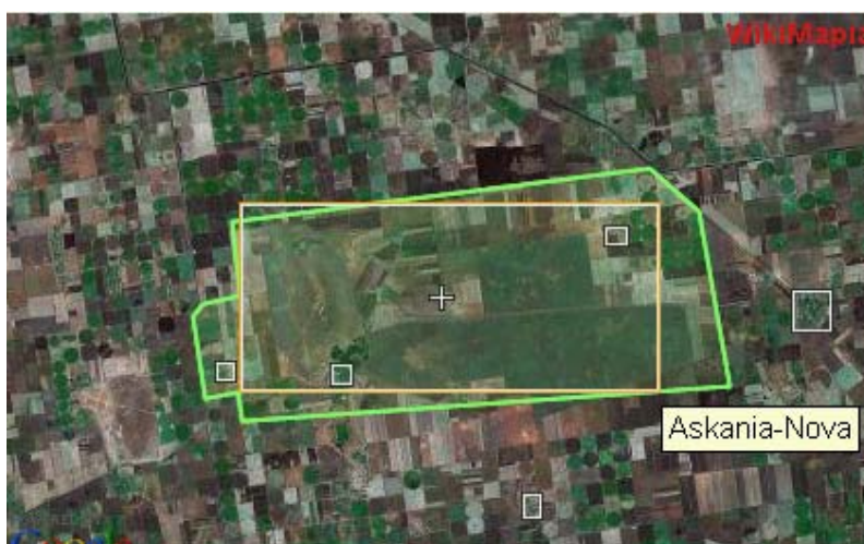
Рис. 4. Карта розташування біосферного заповідника “Асканія-Нова” на основі геоінформаційних систем [11]

Дидактичні матеріали на основі геоінформаційних систем, що являють собою карти територій (рис. 4), дозволяють студентам вивчати місця розташування заповідних об’єктів. За допомогою гіперпосилань студент має можливість „перейти” від карти заповідного об’єкта до загальної інформації про цей об’єкт.