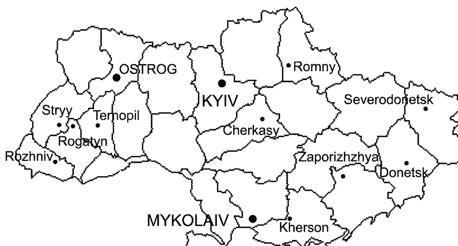
Рис. 2. Києво-Могілянська мережа на мапі України

Оскільки мережа географічно поширена, вона спроможна розповсюджувати знання про інформаційні технології у школах всієї країни, що вже фактично робиться. Серед перших проявів такої діяльності – дві українські громадські організації: Вікно в світ та Українська бібліотечна асоціація – виявили готовність приєднатися до руху надання допомоги спеціалізованим школам для учнів з вадами зору. Відтак перелік методів усунення освітніх бар'єрів поповнений ще одним пунктом, відомим як адаптивні технології.