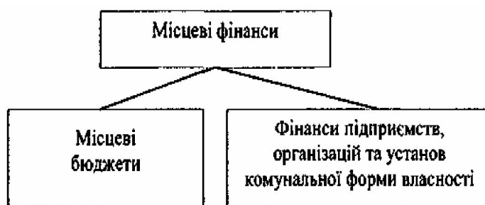
Схема 5. Склад місцевих фінансів

Процес формування місцевих фінансів України супроводиться значними труднощами, пов'язаними з численними факторами. Один з них – необхідність ліквідації деформацій у фінансовій системі, що сформувалися в попередній період. Інший фактор, який стримує формування місцевих фінансів, – відсутність сучасного управлінського досвіду організації фінансової системи, сформованого правового поля, політичної культури і традицій, без яких не можуть існувати фінанси місцевих органів влади. Склад місцевих фінансів показано на схемі 5.