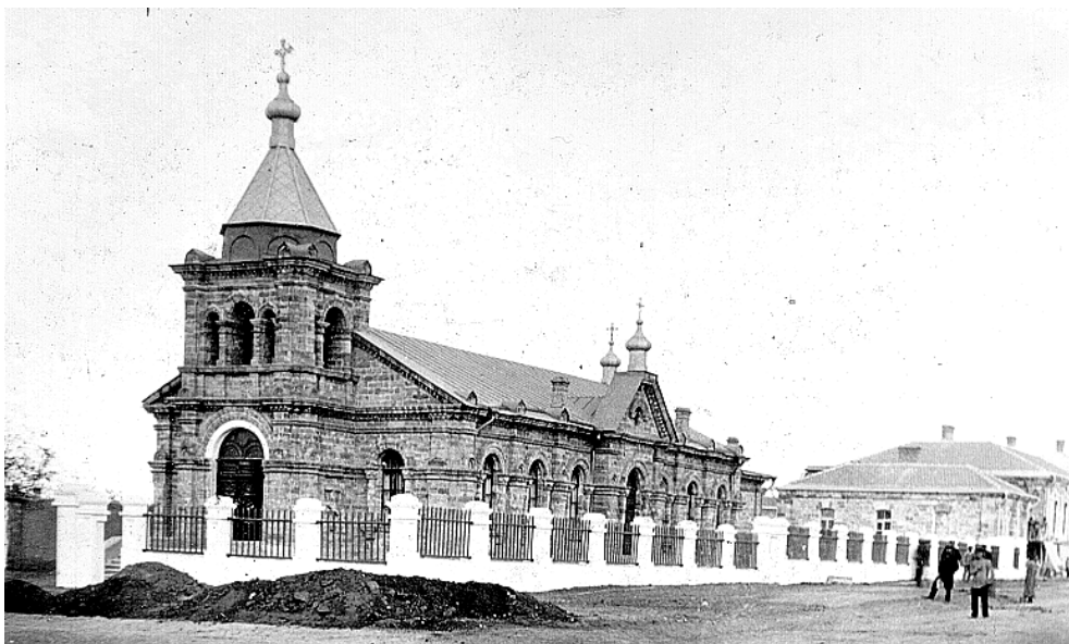
Свято-Миколаївська церква 58-го піхотного Празького полку