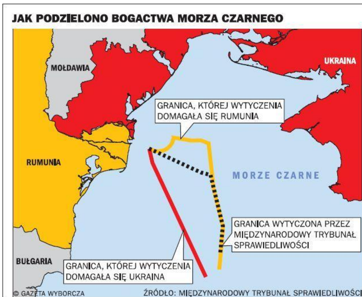
Załącznik nr 1. Podział bogactw Morza Czarnego – stanowiska Ukrainy, Rumunii oraz werdykt Międzynarodowego Trybunału Sprawiedliwości ONZ w Hadze