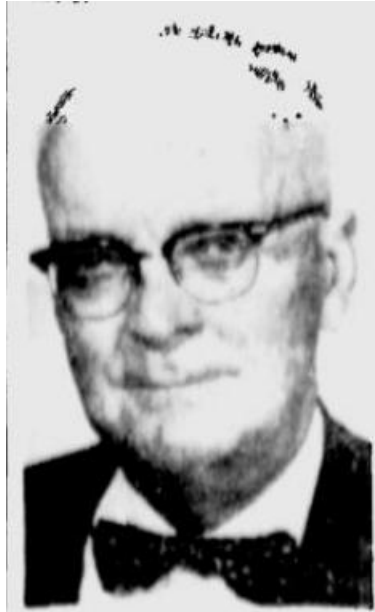
Фото. Філіп Мей Хамер [38].

1943 р. Президент Ф. Д. Рузвельт закликав державні установи зберігати звіти про виконання їх обов'язків у період Другої світової війни. Був сформований Комітет по зберіганню звітів державних установ воєнного періоду. 4 червня 1946 р. Президент Г. С. Трумен (1945-1953) звернувся до Архівіста США С. Дж. Бакка і доручив йому укласти довідники архівних документів воєнного часу [15]. Під керівництвом Ф. М. Хамера [16] 1947 р. було здійснене видання «Федеральні документи Другої світової війни» [17], 1948 р. світ побачив перший Путівник по документах Національного архіву [18], що містив інформацію про майже 800 тис. куб. футів документів, які знаходились на той час на зберіганні у NARA. Співро-